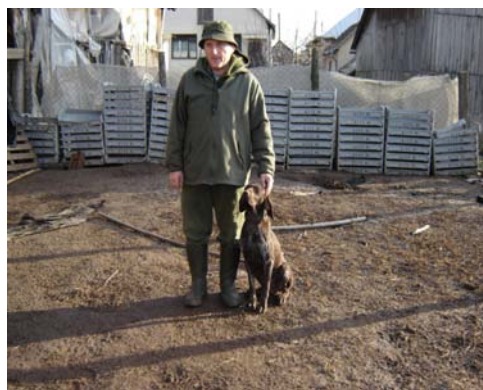
A német vizsla és gazdája

Több kutyafaj van, melynek adottságai megfelelnek a vadászat kiképzésére. Ha egy nemzetközi versenyt nézek, melyben tapasztalatom is van, a legtöbb vadászkutya a vizslák közül kerül ki. Én magam német vizslákat tenyészték és képezek ki.