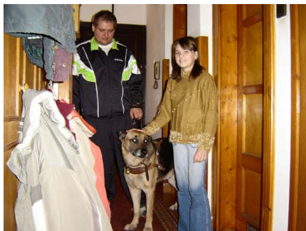
Hármasban indultunk sétára